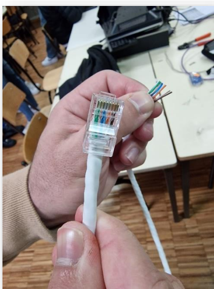
Figura 1 - Ordenar as cores

No âmbito da disciplina de Automação e Computadores do Curso Técnico de Eletrónica Automação e Computadores, os alunos realizaram atividades que lhes proporcionaram a aprendizagem de crimpar cabos de rede Ethernet de CAT5 e CAT5e. Os discentes manifestaram empenho e interesse nas várias etapas de elaboração dos cabos, a saber, separação dos fios trançados, posicionamento dos fios na ordem certa, encaixe dos fios na ficha RJ45, crimpagem da ficha com ajuda do alicate, testagem do cabo e ainda inseriram os fios na ficha RJ45 fêmea usando a norma T568B.