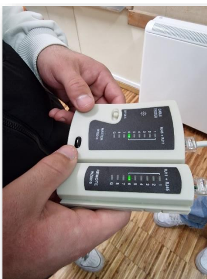
Figura 3 – Testar os cabos