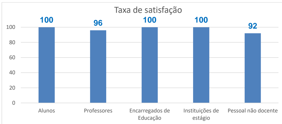
Gráfico 1- Dados relativos ao ano letivo 2019-20